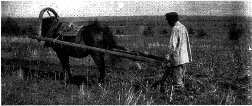
Перасяленец у Сібір з Вілейскага павета Мінскай губерні.