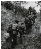
Кадр из кинохроники "Перебазирование"